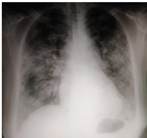
Figura n 1

Radiografía de tórax, AP. Imágenes de consolidación en ambos campos pulmonares, bilaterales, de predominio periférico y campos medios y basales. Paciente femenino con COVID-19. Caracas, junio de 2020.